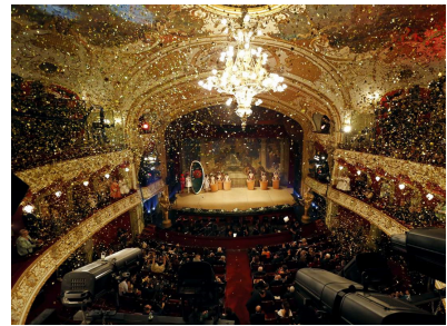
Les Fleurs printre confetii